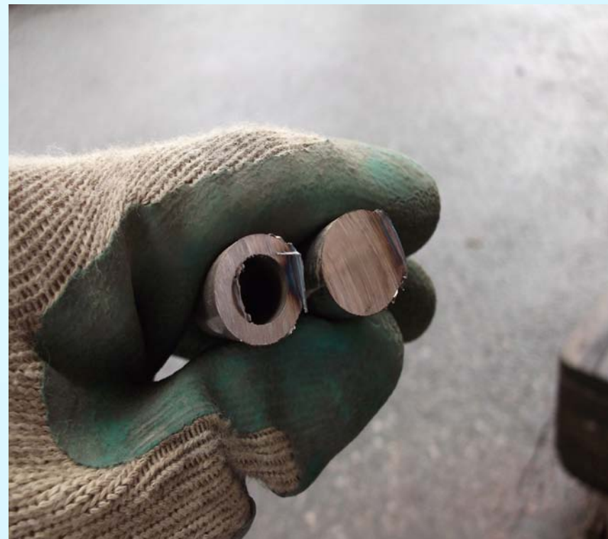
< 他社 1 mm >