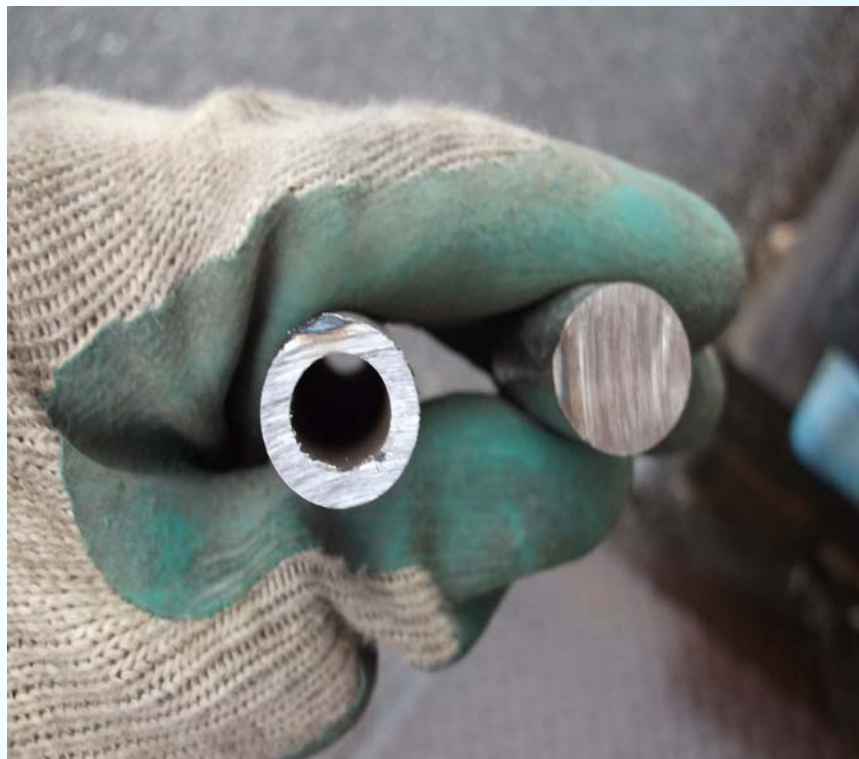
< トーホー社 0.8 mm >