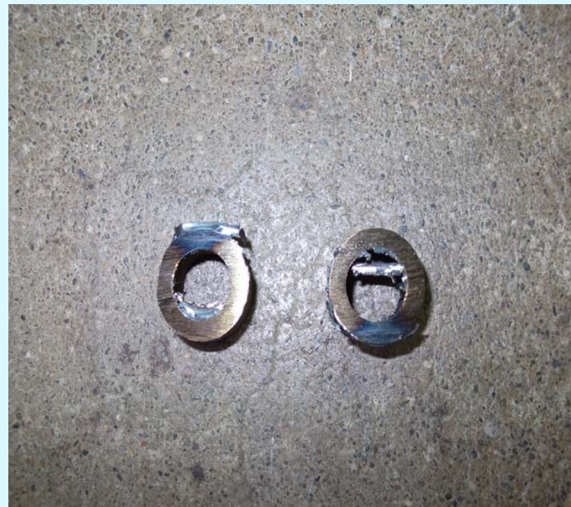
< 他社 1 mm >