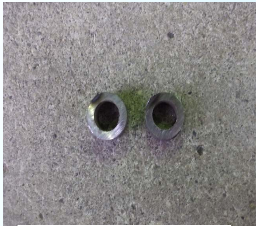
< トーホー社 0.8 mm >